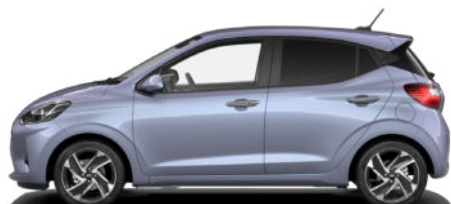
Meta Blue Pearl Kontrastdach verfügbar nicht für N Line