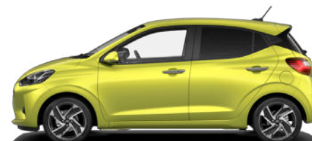
Lucid Lime Metallic Kontrastdach verfügbar